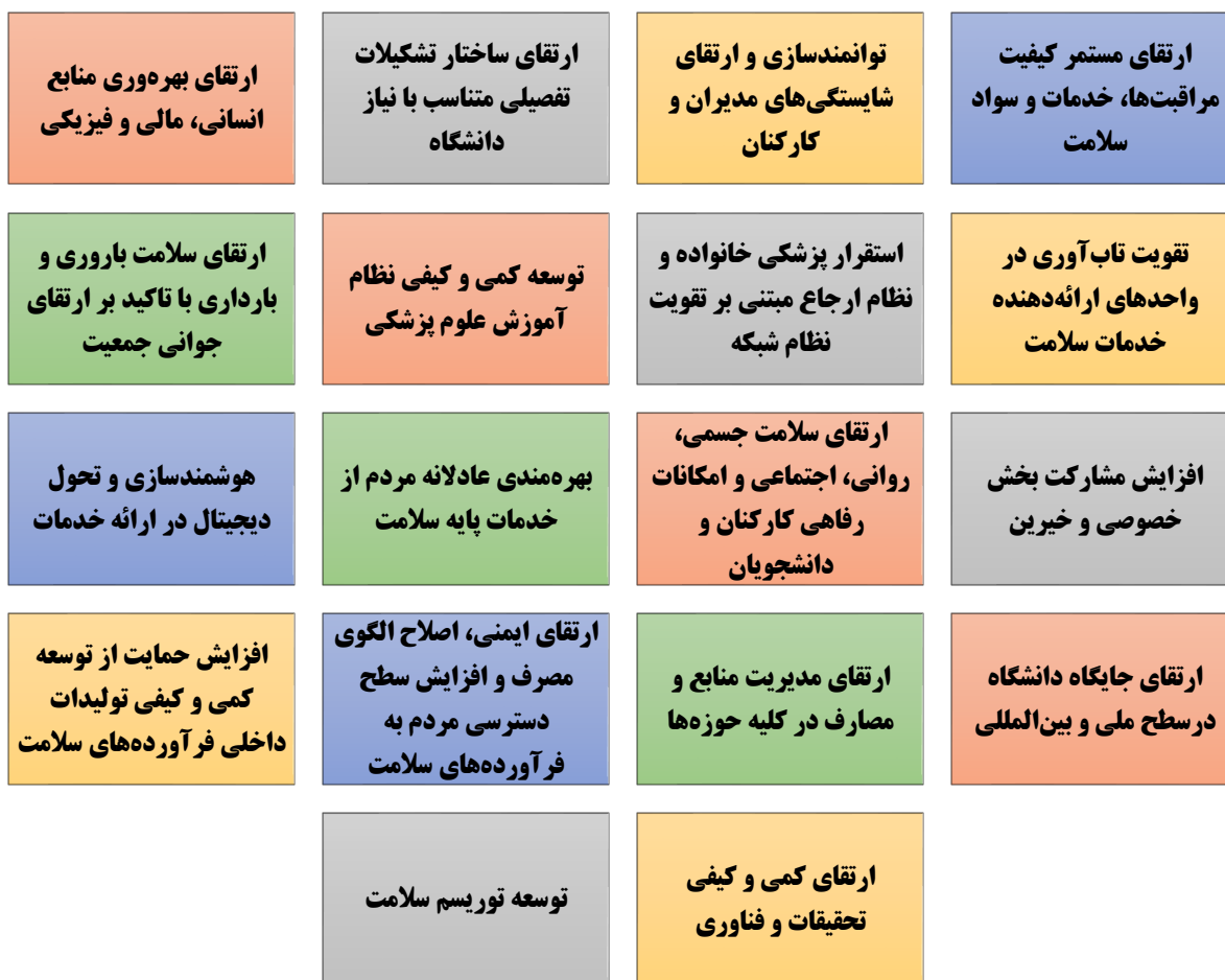
شکل ۳: اهداف کلان دانشگاه علوم پزشکی ابن سینا استان همدان